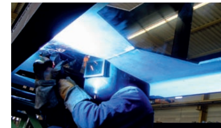
Schweißen im Behälterbau